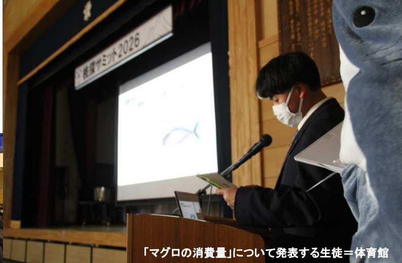
「マグロの消費量」について発表する生徒＝体育館