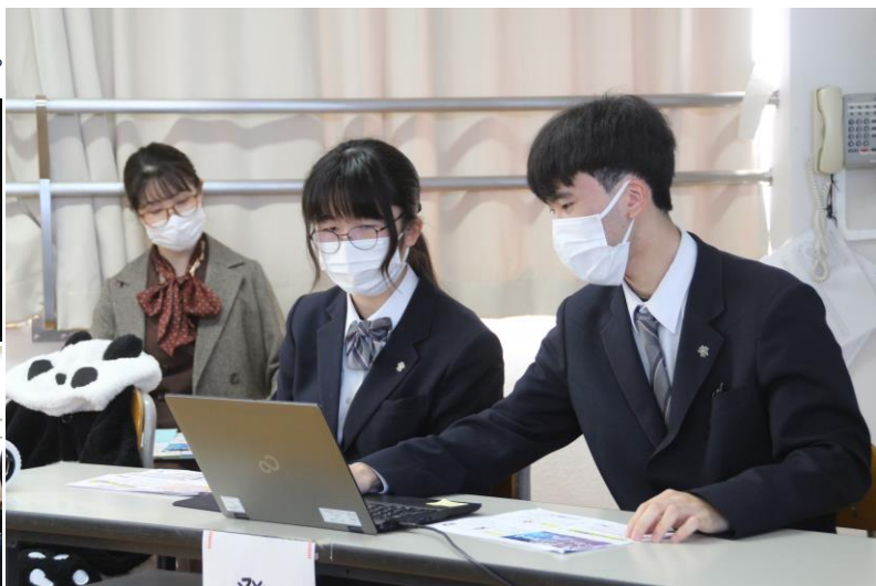
睡眠について発表する3年生徒(右写真)とその発表に対して助言などをするアドバイザー(左下写真:左端)=3年教室