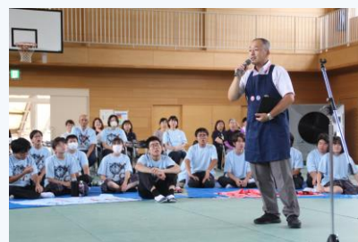
文化祭の閉祭式。全校生徒に囲まれ、 講評する校長=昨年9月13日 体育館

生徒たちは、「当たり前前の方が当たり前前ができる」姿をめざし、校訓「一日一日を大切に」を胸に、それぞれが「自立」をめざして挑戦し、己に打ち克ち、誇りと自信を育んでいくことを心より願っております。