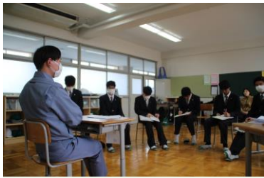
清掃会社に勤務するセンパイを 囲んでリアルな話を聞く生徒

分科会「働くリアル」に続いて、全体会「社会人リアル」では仕事や職場、車の免許、趣味や休日の過ごし方などセンパイの本音トークが聞けて、社会人になる心構えについて多く学ぶことができました。