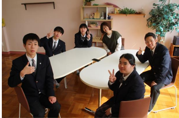
昼休みの時間、地域コミュニティエリアに集まりそれぞれの思いを語った=3月2日

主任:親へのプレゼント、ぜひ実現させてくださいね。自転車で毎日通勤するようだから、乗るたびに「私の初給料で買ったんだ」という気持ちになるよね!ここまでみなさんに語っていただきましたが、社会に出る不安よりも期待や楽しみの方が多くあるようだから安心しました。卒業まであと3、4日ぐらいになりますが、悔いのないように過ごしてください。