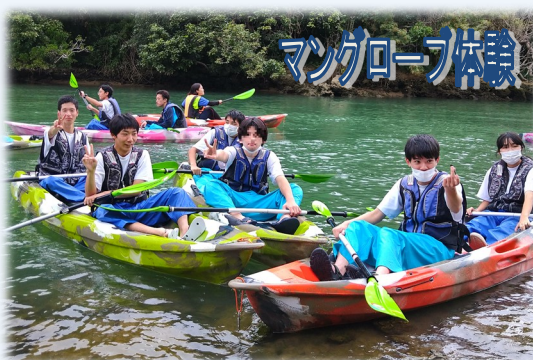
マングローブ体験