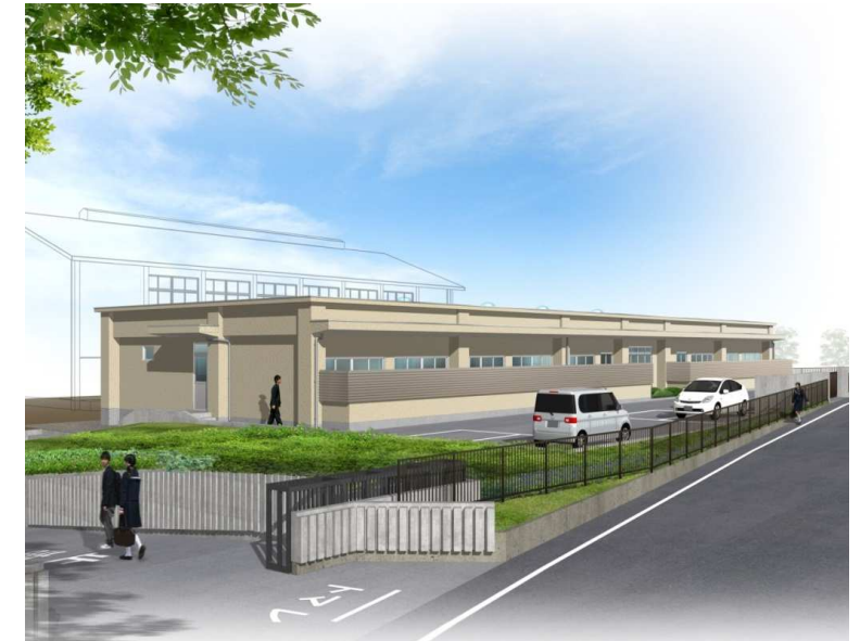
山梨県立高等支援学校桃花台学園寄宿舍